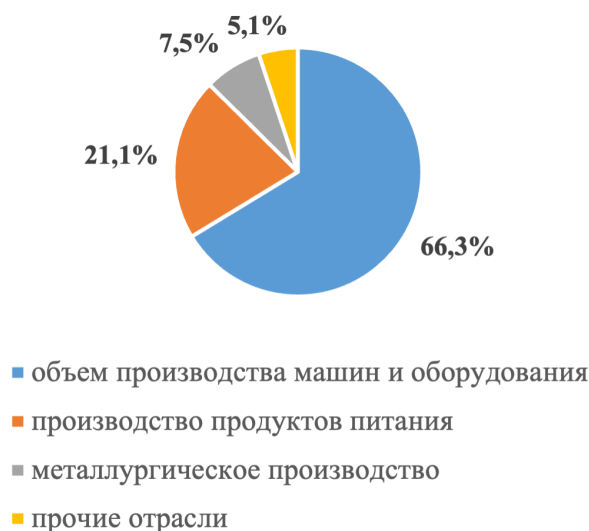
Рисунок 4. Структура обрабатывающей промышленности г. Костанай