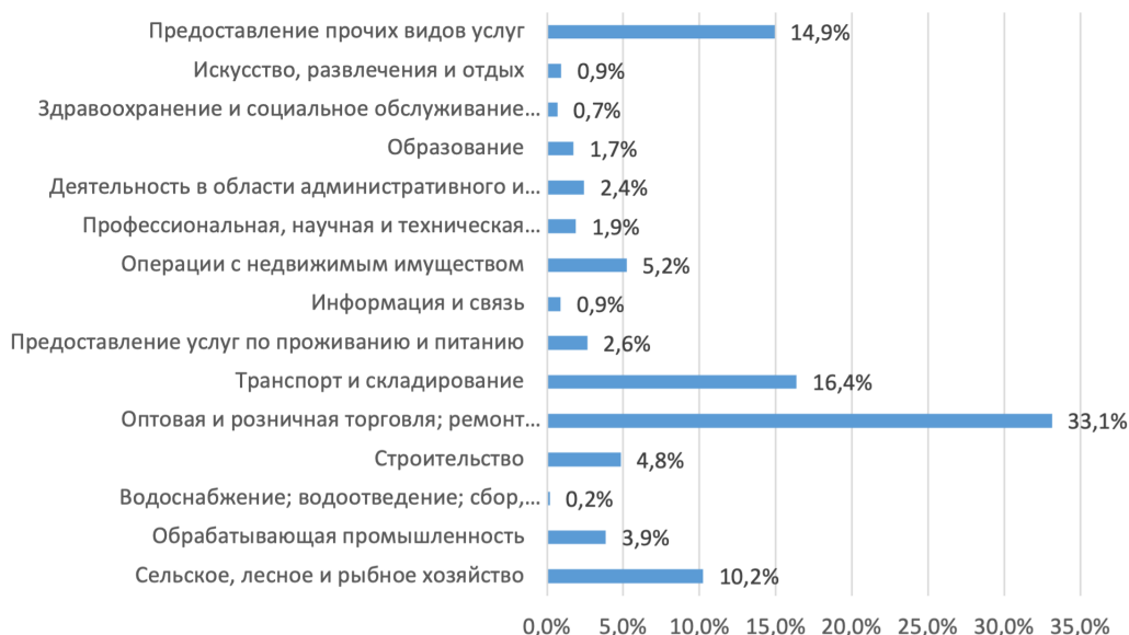
Рисунок 3. Зарегистрированные субъекты индивидуального предпринимательства по видам экономической деятельности по состоянию на 01.02.2026г.

В структуре ИП доминирует сфера торговли - 33,1%, транспорт и складирование - 16,4%, предоставление прочих видов услуг – 14,9% и сельское, лесное и рыбное хозяйство – 10,2%. Незначительная доля операции с недвижимым имуществом – 5,2%, строительство – 4,8% и обрабатывающая промышленность – 3,9% и т.д. (рис.3).